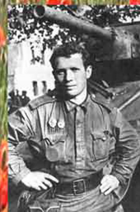
Гвардии лейтенант Бороздин Николай Павлович. 17 гв. ТБр 1-го гвардейского танкового корпуса. 1943 г. Погиб в январе 1944 в Белоруссии. Его танк первым ворвался в Орел.