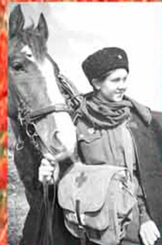
Девушка-санинструктор из состава 1-го гвардейского танкового корпуса.