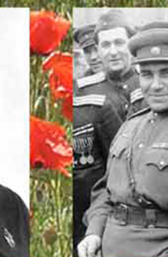
Командант Берлина Герой Советского Союза Николай Эрнстович Берзин. Погиб 18 июля 1945 г. Спас Берлинские отступающие советские. В призыве №1 сразу после окончания войны в должности старшего лейтенанта выдвинул в кандидаты на высшие должности в вооруженных силах его полк. В Берлинском наступлении участвовало более 10000 Берлинцев.