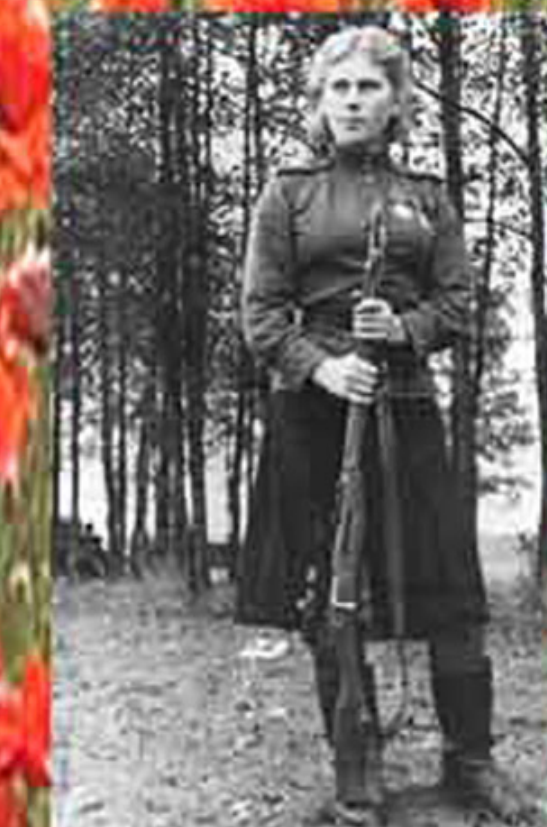
Снайпер Роза Шагина. Уничтожила 64 солдат и офицеров, среди которых 12 снайперов. Кавалер ордена Славы 2 и 3 степени. Погибла в бою 28 января 1945 года в Восточной Пруссии.