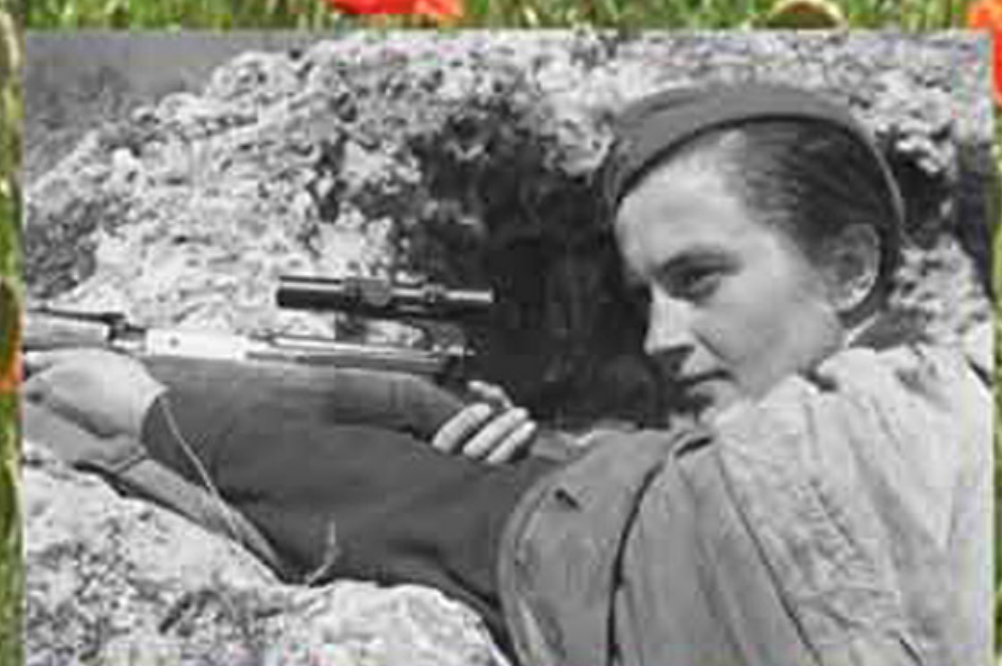
Герой Советского Союза снайпер 25-й Чапаевской дивизии Людмила Михайловна Павличенко. Уничтожила свыше 309 фашистских солдат и офицеров, в том числе 36 вражеских снайперов. Участник героической обороны Одессы и Севастополя.