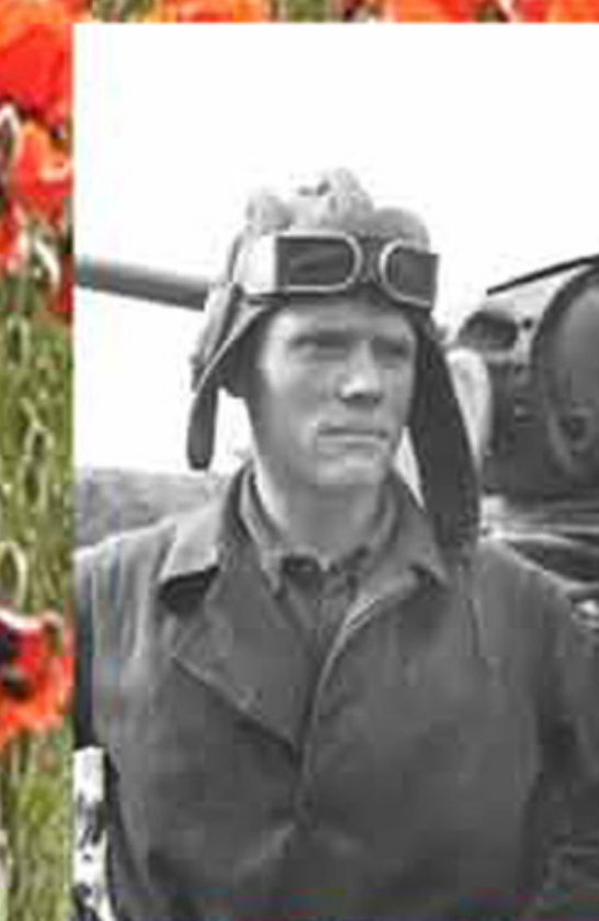
Неизвестный механик-водитель танкового танка Т34-1.